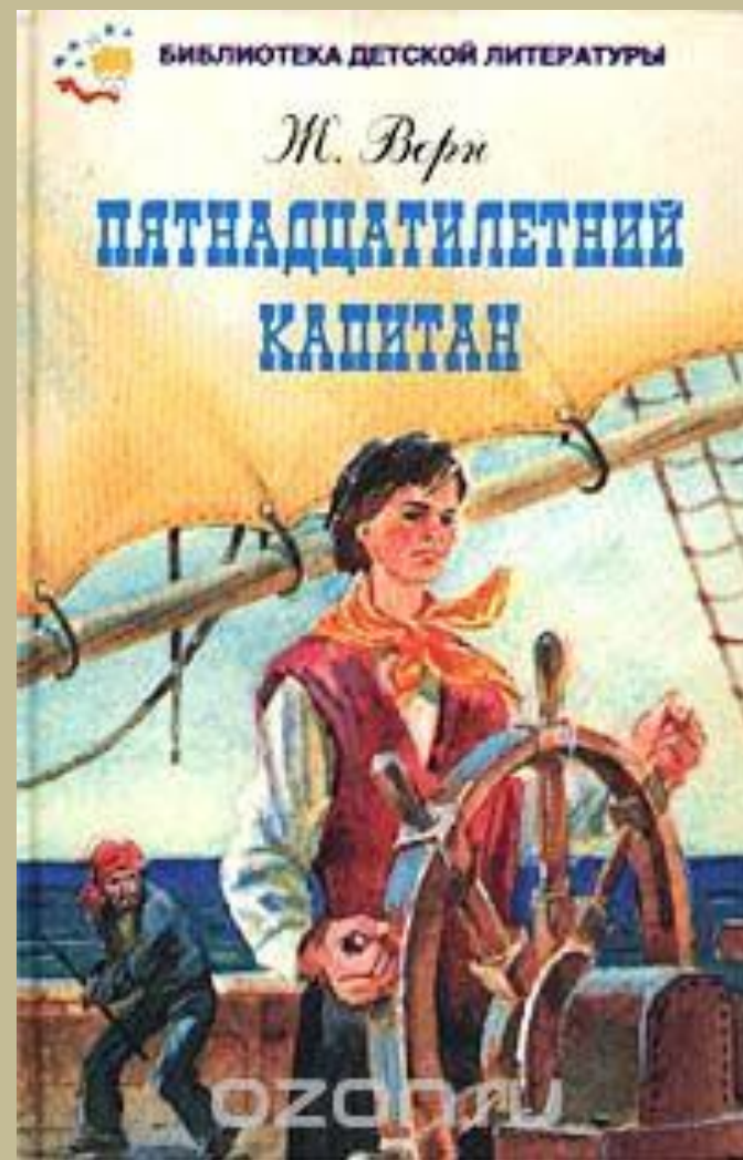
Жюль Верн "Пятнадцатилетний капитан" Издательство «Книги «Искателя» 2002 год издания. Библиотека детской литературы Язык: Русский

В романе описываются приключения пассажиров китобойной шхуны-брига «Пилигрим», весь экипаж которого (5 матросов и капитан) погиб в результате схватки с китом. На судне находились пассажиры миссис Уэлдон и её маленький сын Джек, кузен Бенедикт (двоюродный брат миссис